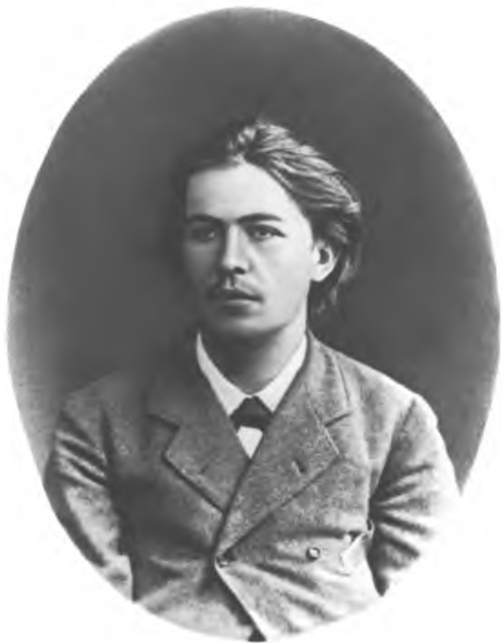
А. П. ЧЕХОВ